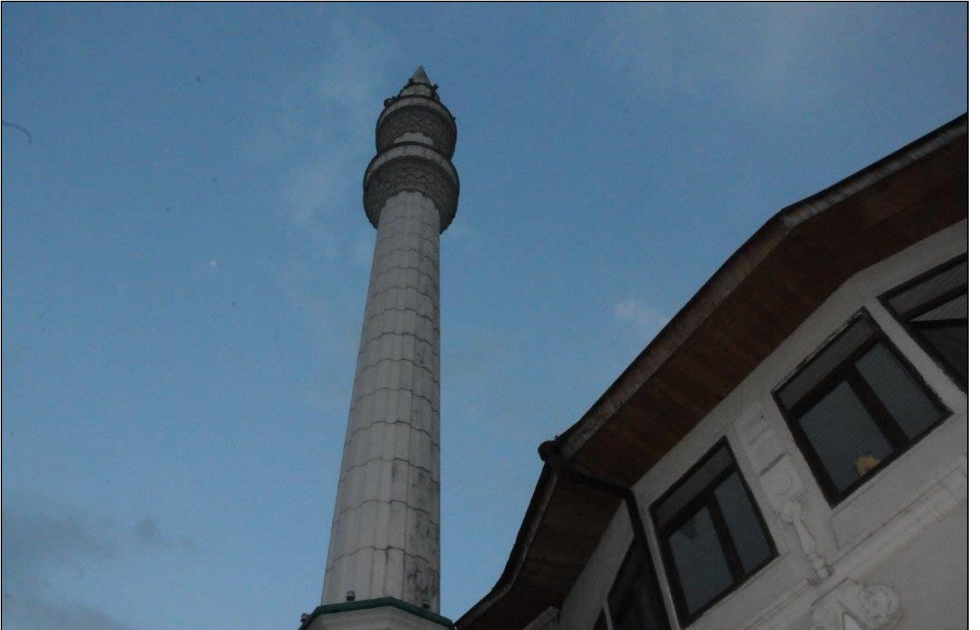
Ecdat Yedigari Orta Camii... 1866