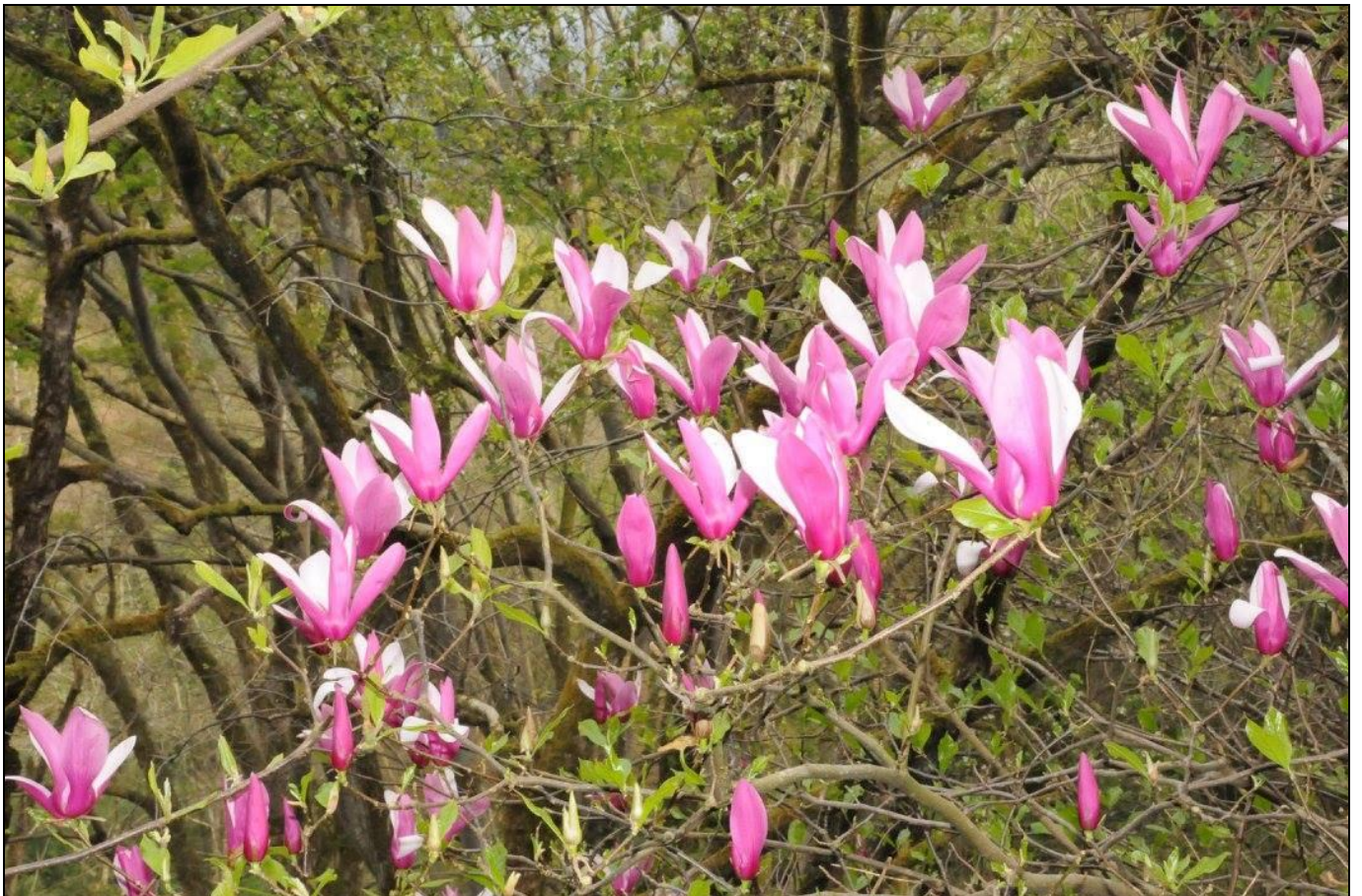
Lale Manolyası... Magnolia liliflora ... Çin