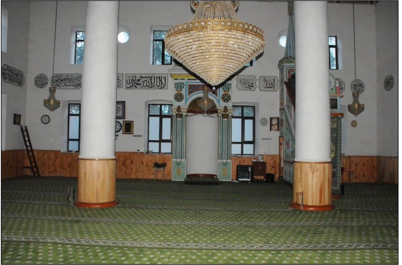
Orta Camii... 1866