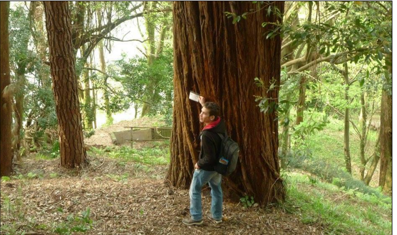
Dev Sekoyalar... Sequoia sempervirens