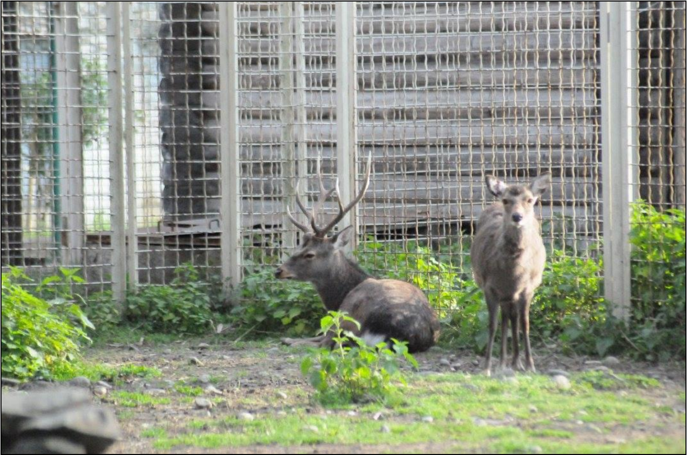
Hayvanat Bahçesindeyiz... Japon Geyiği ( Cervus nippon )