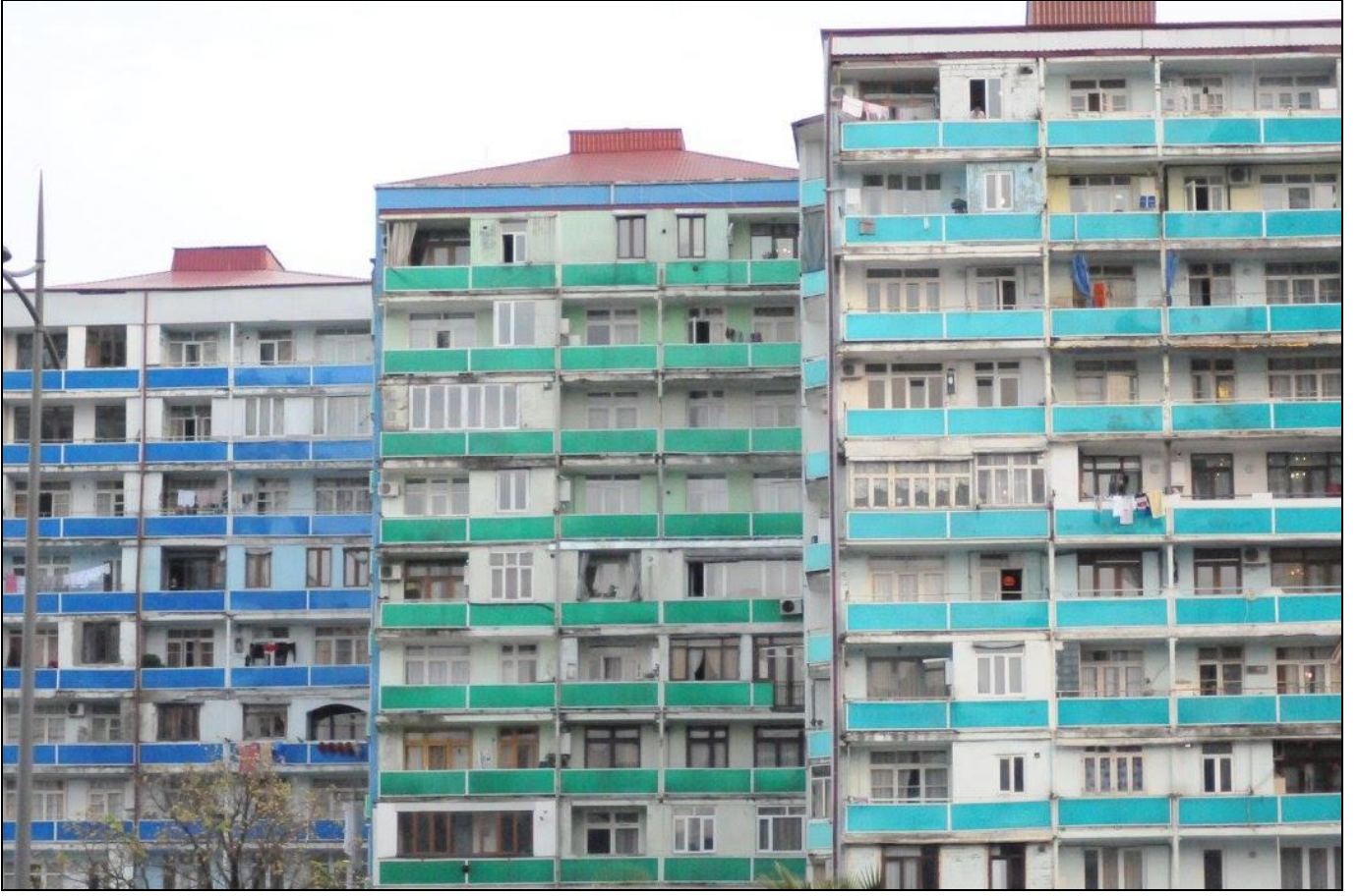
Bir Yanda Bir Oda, Bir Mutfak...