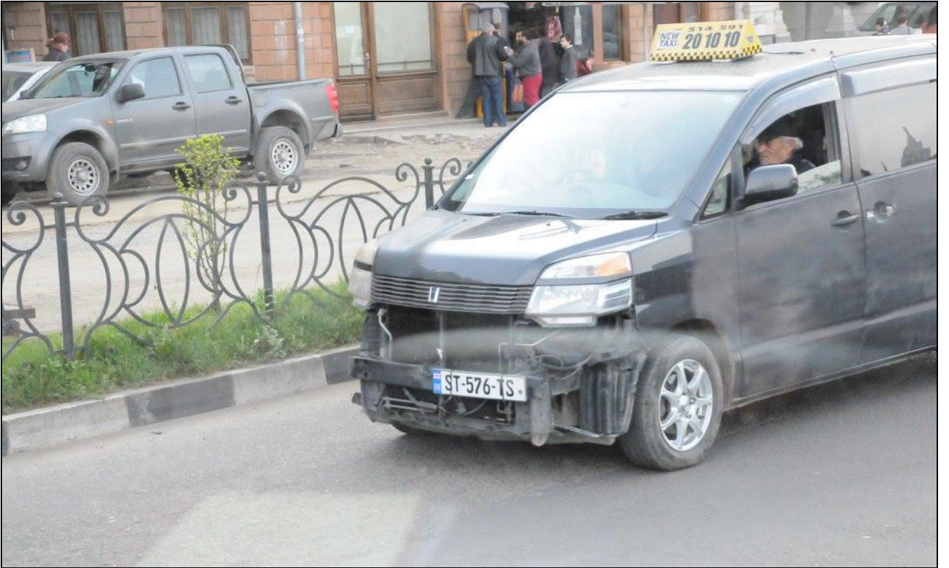
Tamponu Vuran Öyle Geziyor...