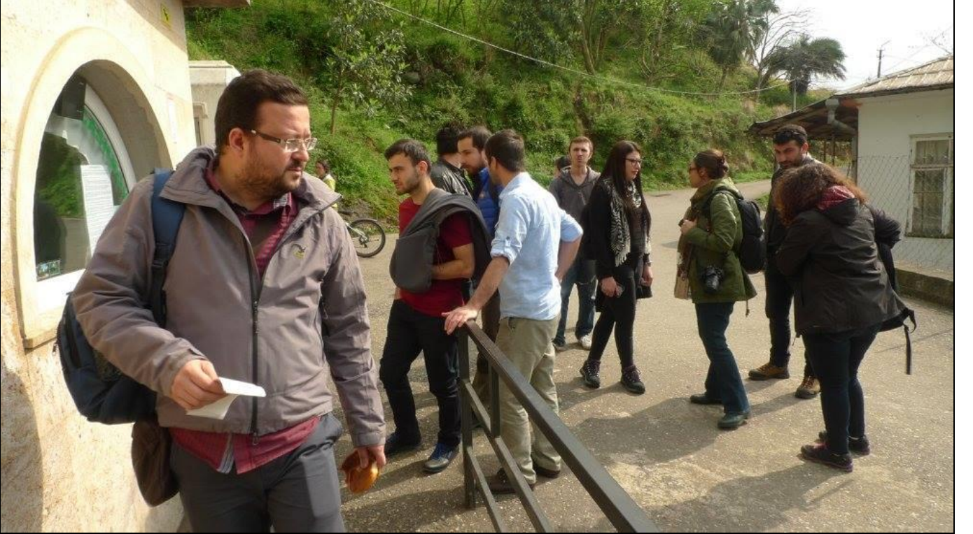
Botanik Bahçesine Üst Kapıdan Giriş