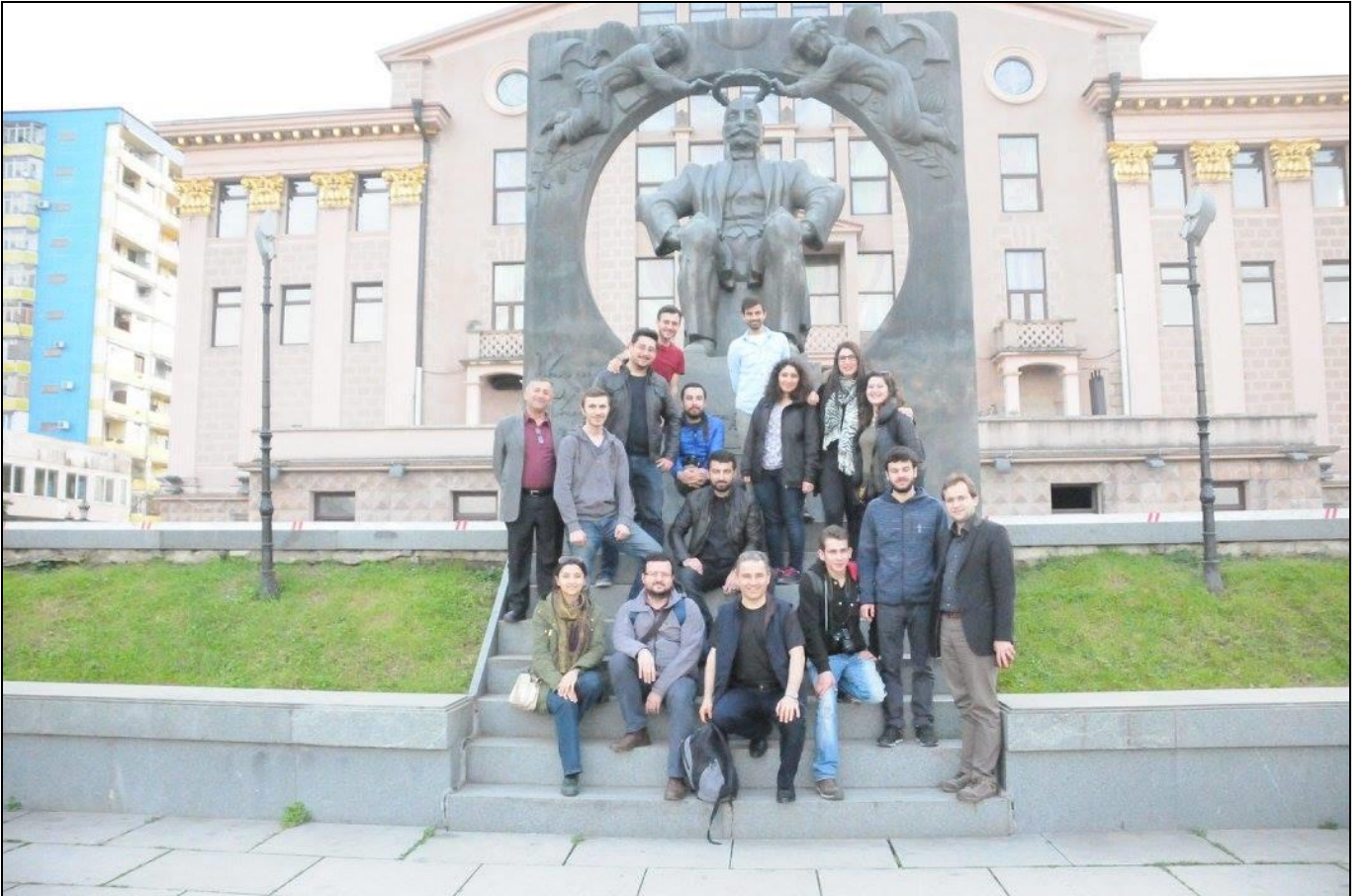
Tipinden tanıyamadık... Önce çekildik, sonra sorduk ve öğrendik... Yazar, Şair, Politikacı vs... Ilia Chavchavadze (1837 – 1907)