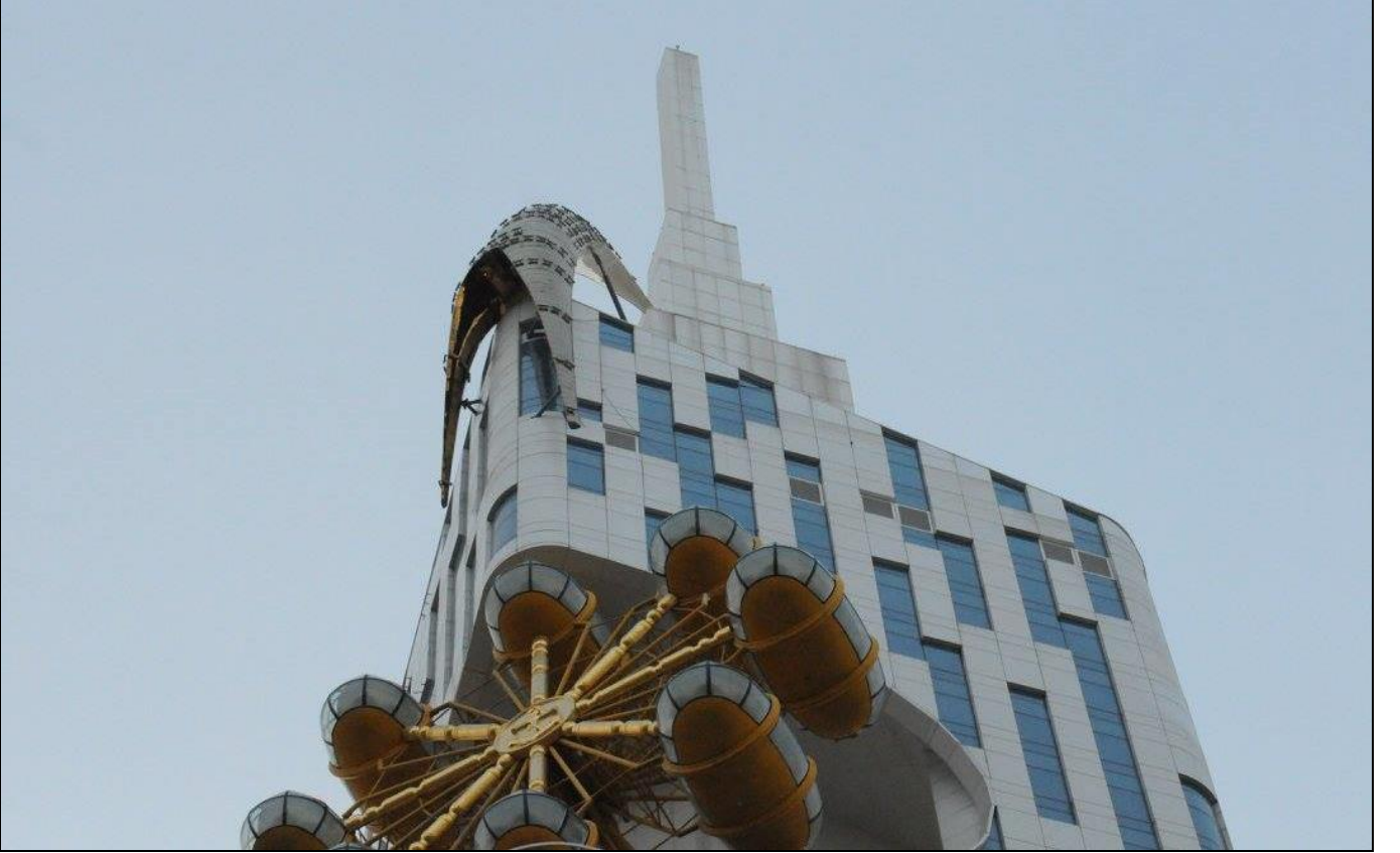
Bir Yanda Lüks...